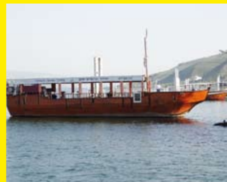
Bilder von der Pilgerreise ins Heilige Land

Montag, 8. u. 22.12. 19 Uhr im Pfarrsaal: Internat. Folkloretänze