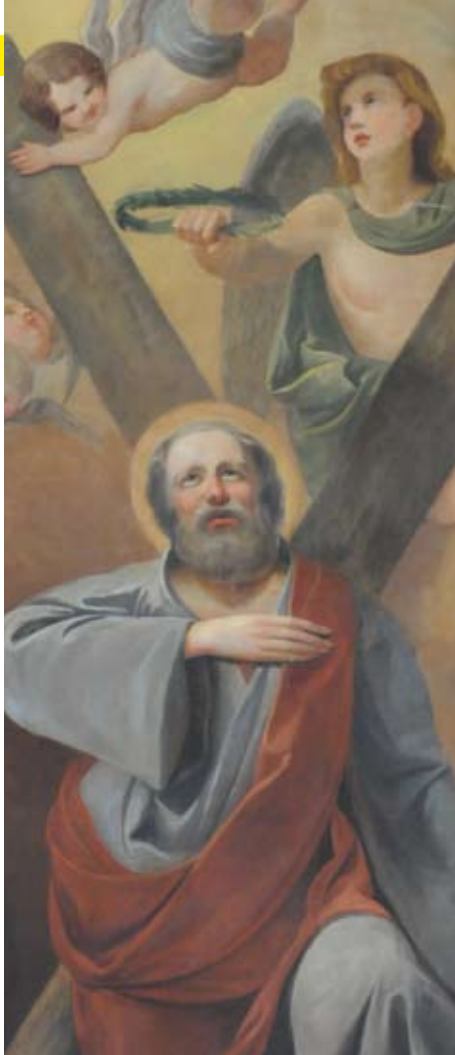
Heiliger Andreas: Hochaltarbild in der Pfarrkirche St. Andrä v. d. Hgt.