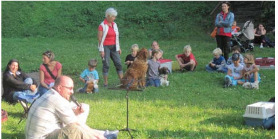
In lockerer Atmosphäre wurden Menschen und Tiere gesegnet